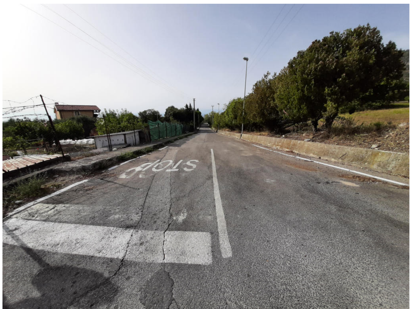
( tratto L - M )