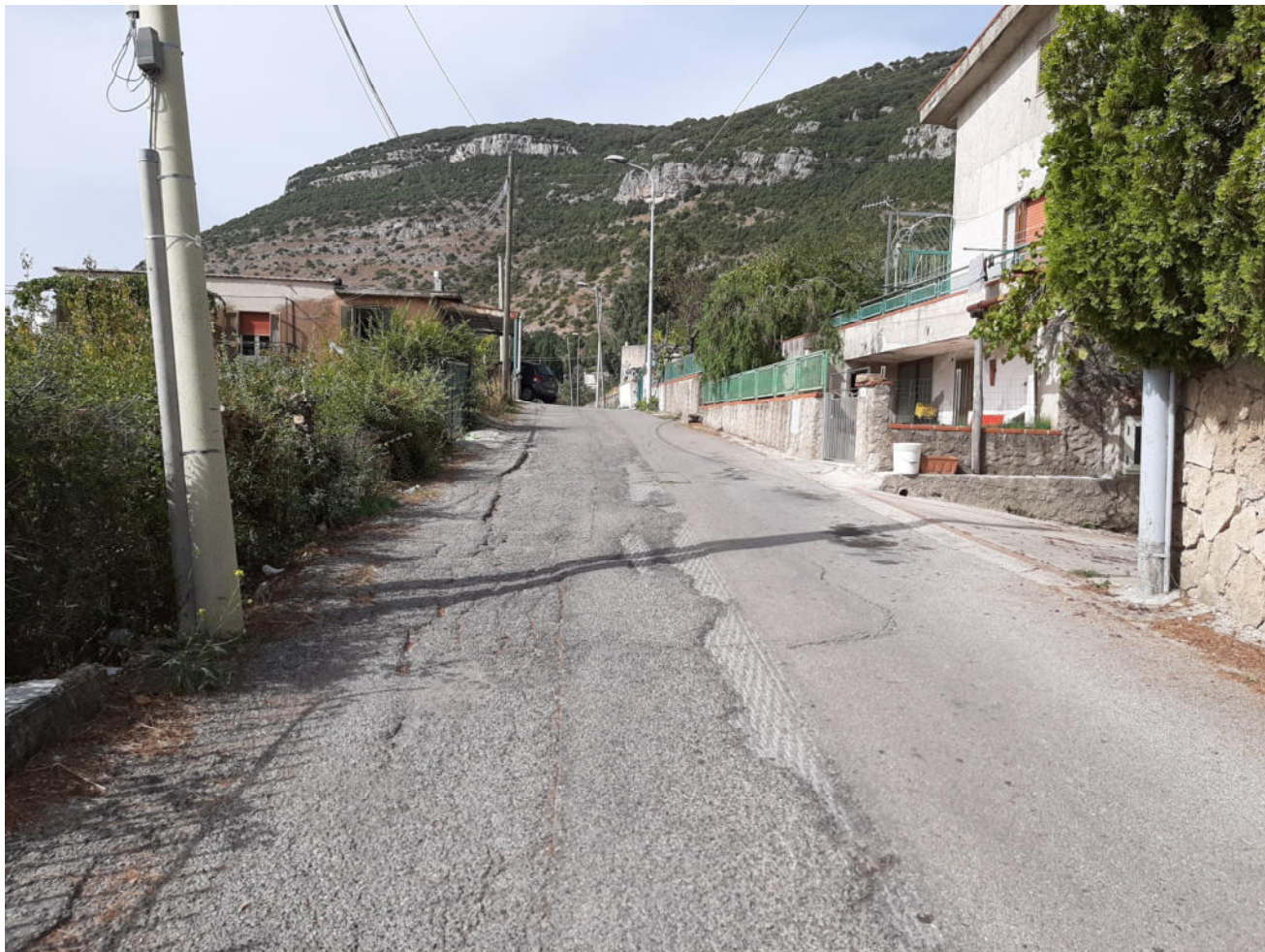
( tratto A - B ) iniziale