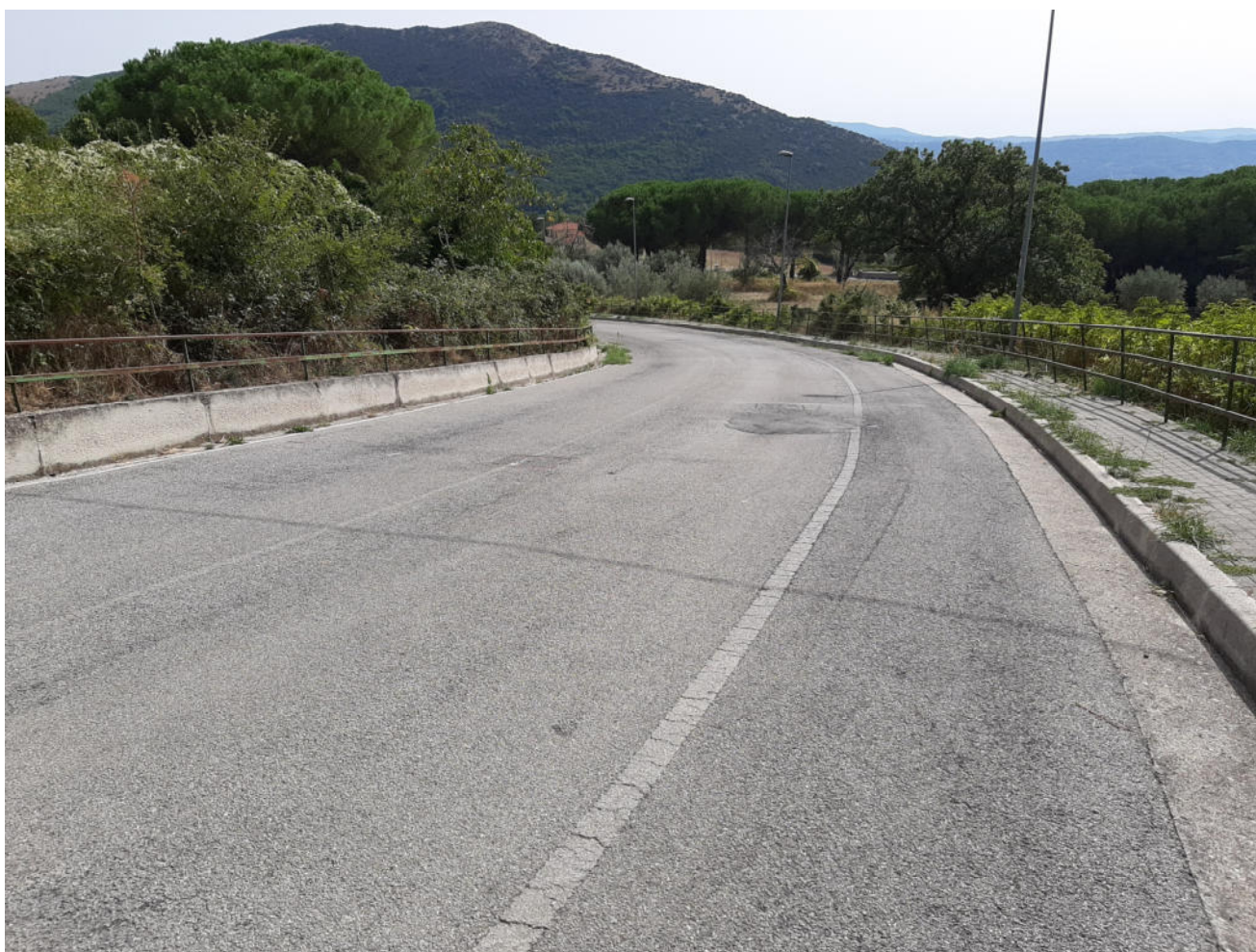
( tratto C - D )