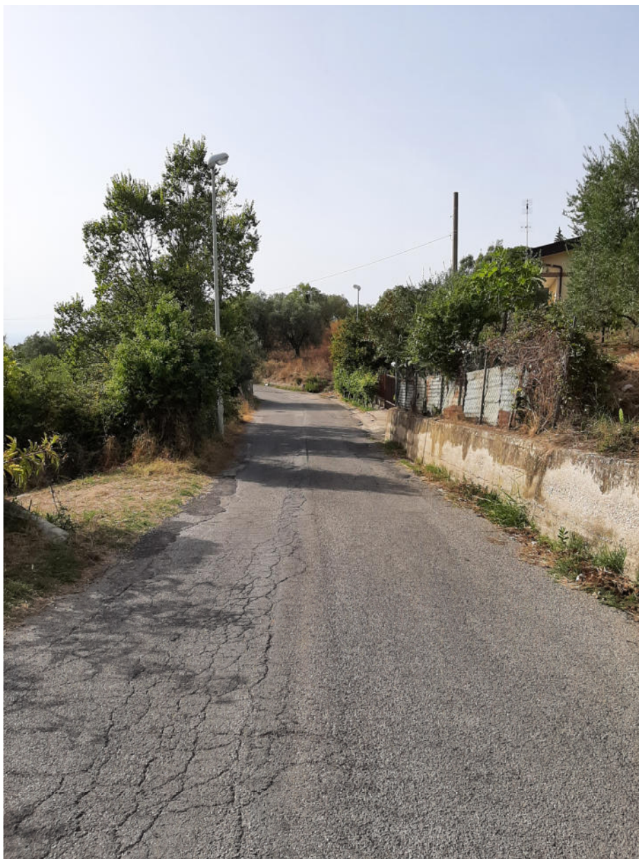
( tratto M - N )