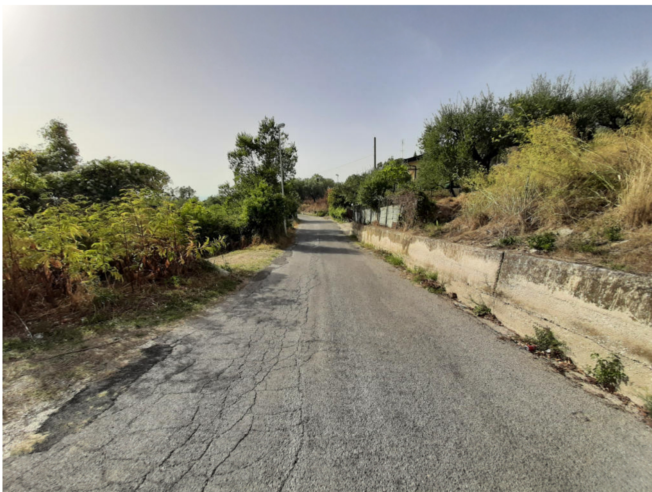
( tratto M - N )