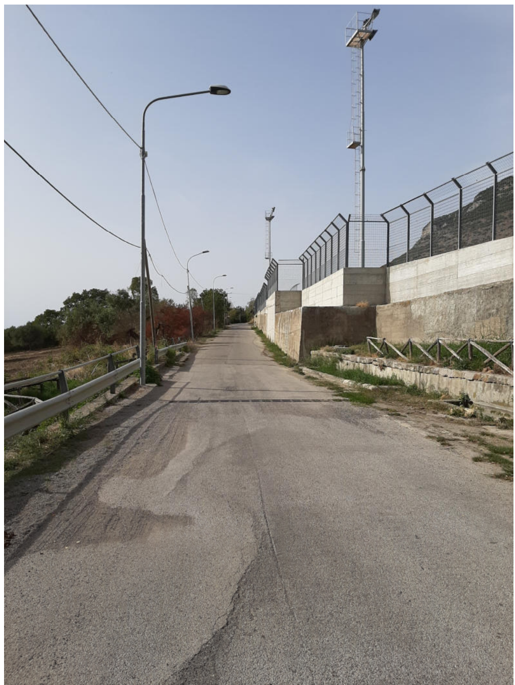
( tratto I - L )