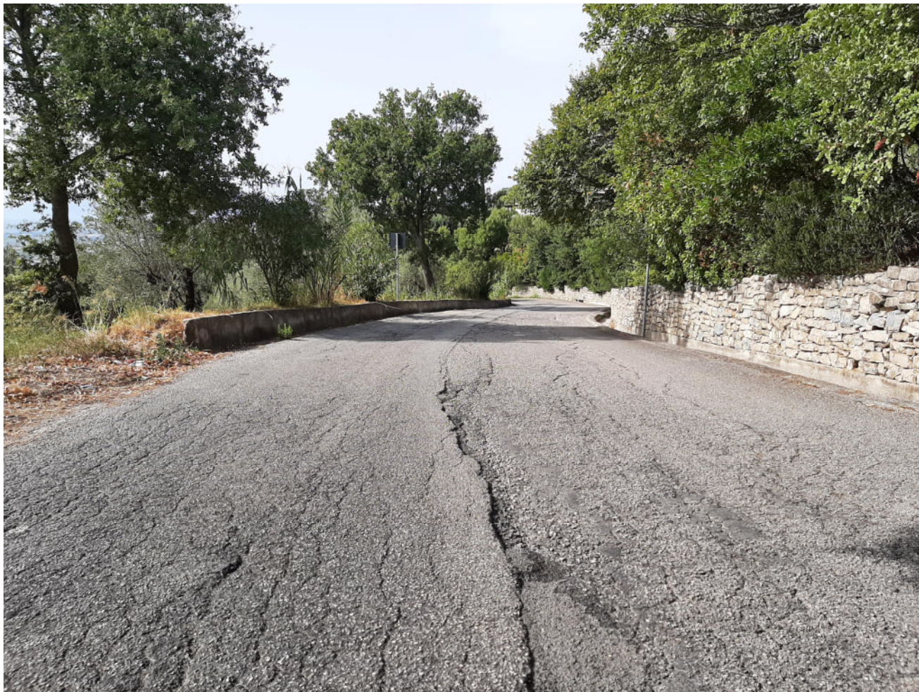
( tratto G - H )