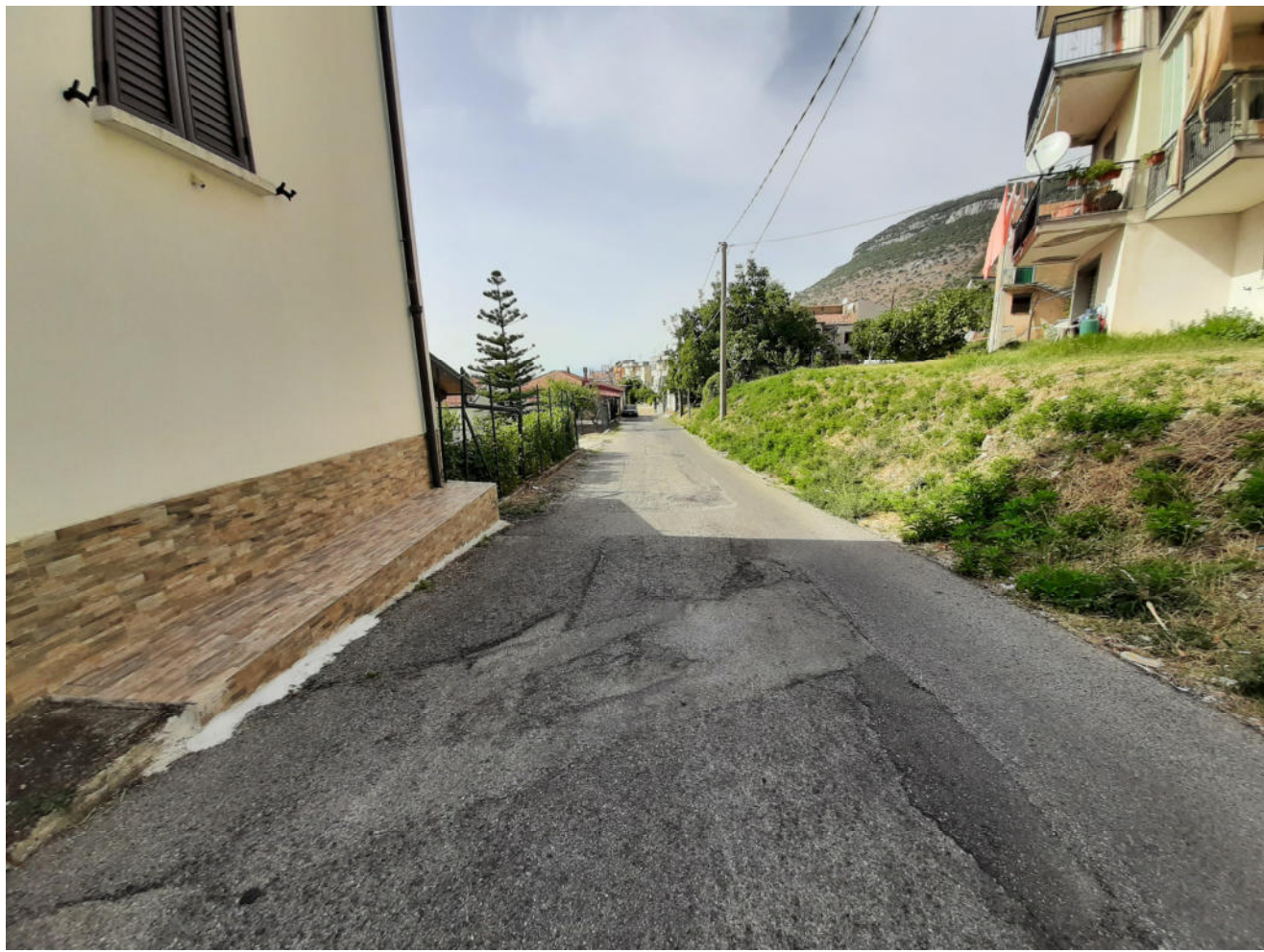
( tratto E - F )