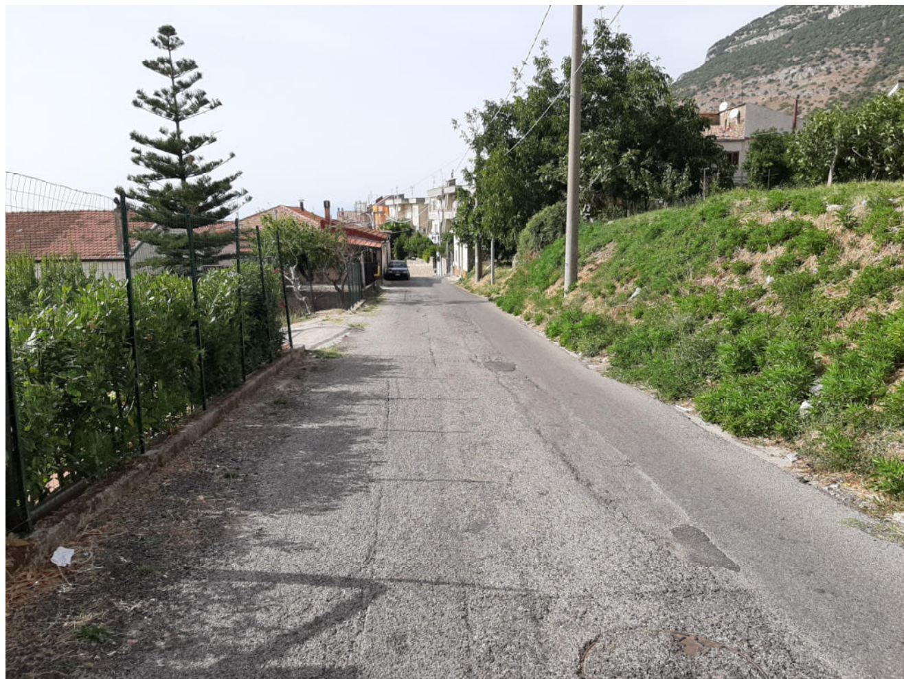
( tratto E - F )