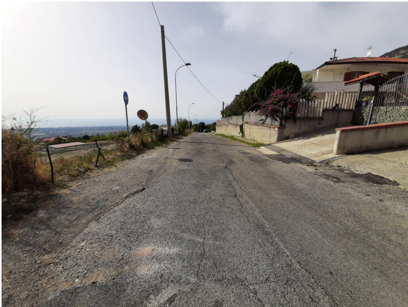
( tratto F -G )