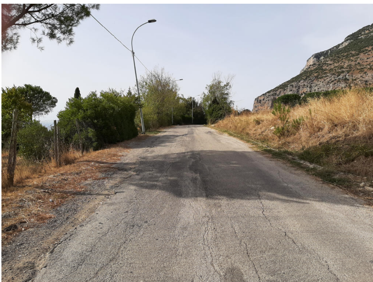
( tratto G - I )