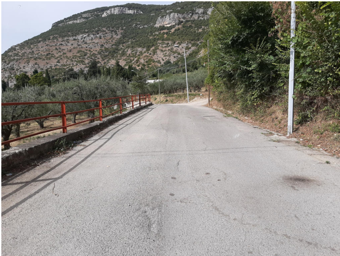
( tratto B - C )