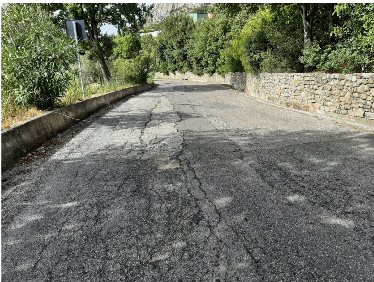
( tratto G - H )